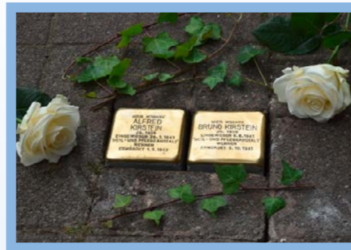
Text: S. Jaekel

Viele Bewohner:innen und Mitarbeitende des Albertushofes sowie etliche Gäste und Pressevertreter waren anwesend. Das große Interesse hat alle sehr bewegt.